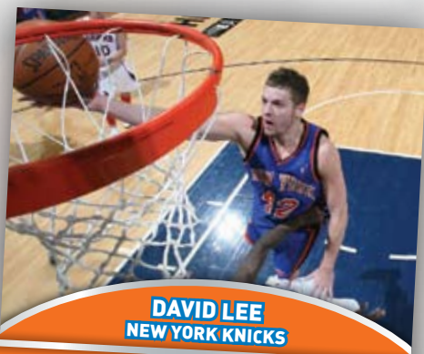
DAVID LEE NEW YORK KNICKS

Altura: 6'9" Peso: 250 libras Virtudes: Doble-doble Arma secreta: Ejercicio cardiovascular Desayuno favorito: Omelet Comida favorita antes de un partido: Dos bagels con pasta de cacahuete y bananas Ejercicio físico favorito que no sea basketball: Correr por la playa Juego favorito en el jardín de la casa: Lanzar la pelota de football