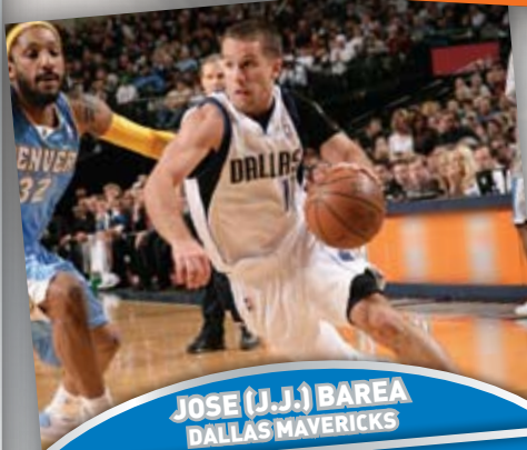
JOSE (J.J.) BAREA DALLAS MAVERICKS

Altura: 6'0" Peso: 175 libras Virtudes: Velocidad Arma secreta: Crossover Desayuno favorito: Jamón, huevos y queso en una bagel Comida favorita antes de un partido: Pollo con pasta Ejercicio físico favorito que no sea basketball: Jugar al tenis Juego favorito en el jardín de la casa: H.O.R.S.E.